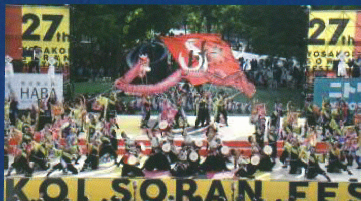
2018年よさこいソーラン祭りにて